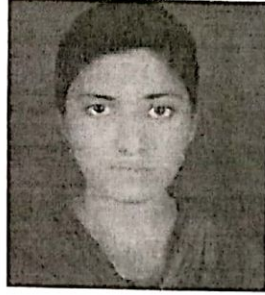
उपाध्यक्ष जयप्रभा साहू